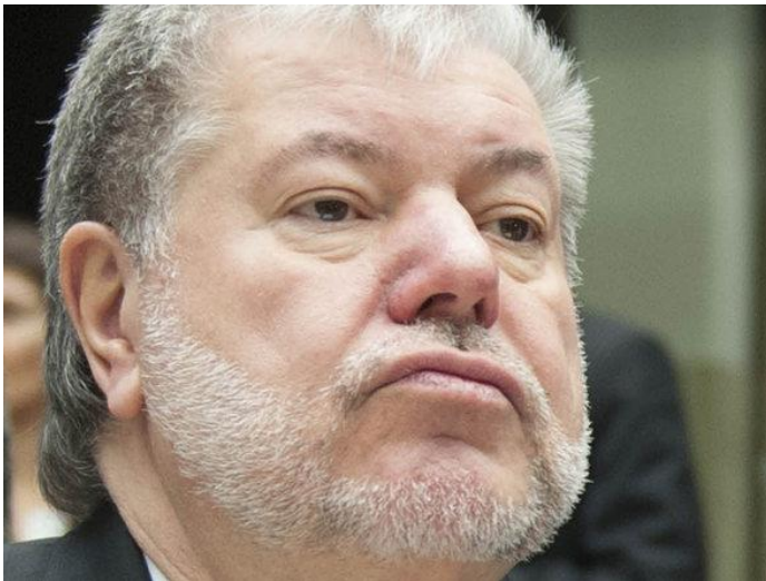
Kurt Beck, ehemals „König“ und Landesvater von Rheinland-Pfalz, hat als Vorsitzender der Rundfunkkommission seine Position zu den SWR-Orchestern klar gemacht.

Hat der SWR die Entscheidung zur umstrittenen Fusion seiner Orchester unabhängig gefällt? So hat es der Intendant stets betont. Jetzt zeigt sich: Die Politik hat Druck ausgeübt – er kam aus Rheinland-Pfalz.