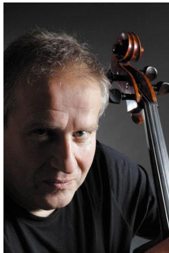
Matthias Deutschmann